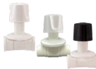
Registro Plástico Pressão Branco