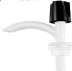
Torneira Plástica 1/2" Lavatório