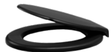
Assento Sanitário Simples - Preto