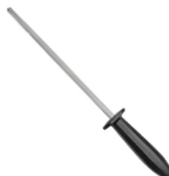
Chaira Plenus Cabo Preto