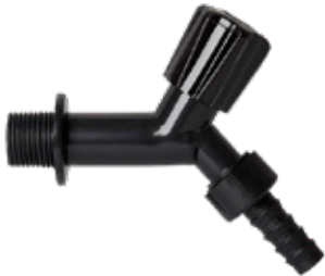
Torneira Plástica para Jardim 1/2" com Adaptador 3/4"