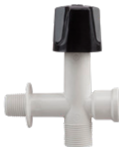
Registro Plástico p/ Máquina 1/2" com Adaptador 3/4"