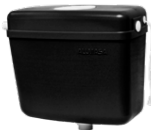
Caixa de Descarga Preta