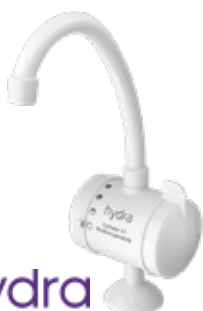
Torneira Elétrica Hydralar 4T - Bancada