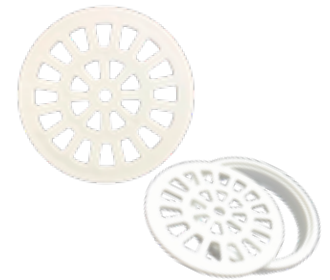
Grelha Plástico Red 100mm