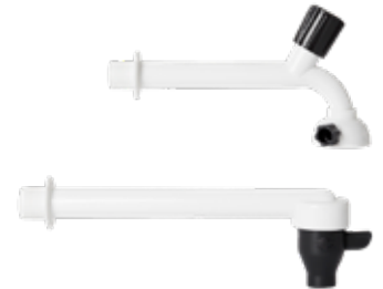
Torneira Plástica 1/2" Cozinha