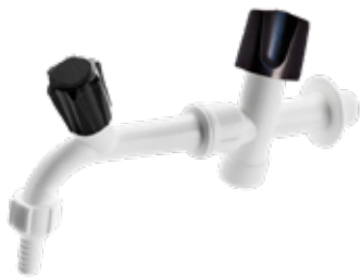
Registro Plástico p/ Máquina com Torneira - Bico 1/2"